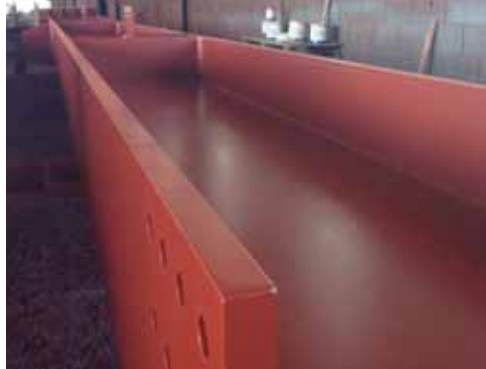
Interseal 1509 utilizado como primer/acabamento