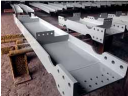
Interseal 1509 utilizado como primer na cor vermelha e acabamento com Interthane 990 cinza

Intervalos de repintura mais curtos significam que mais demãos podem ser aplicadas por turno, VOC menor que 250 g/l e melhores propriedades de aplicação, como excelente retenção em arestas, quinas e cantos vivos.