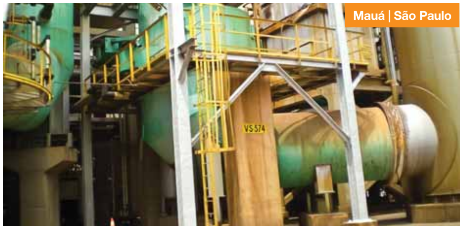
Mauá | São Paulo