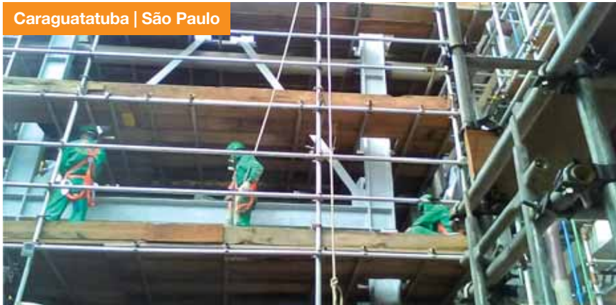
Caraguatatuba | São Paulo